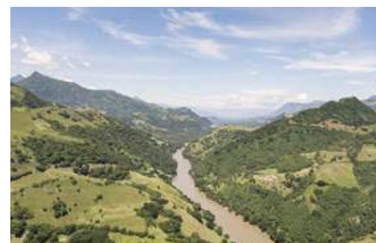
San Gil Santander