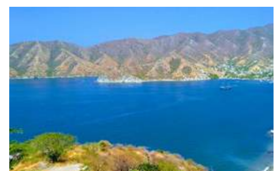
Taganga Santa Marta

*Aplican términos y condiciones dependiendo la temporada