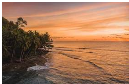
Santa Marta Magdalena